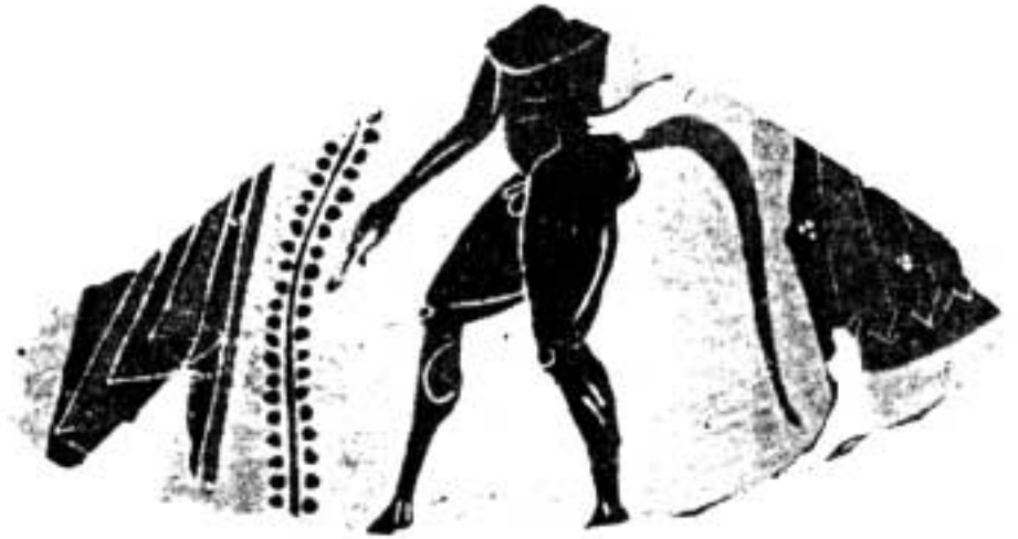
4. Fragment de cratère (psykter ?) attique à figures noires : Dionysos, satyres et ménades.