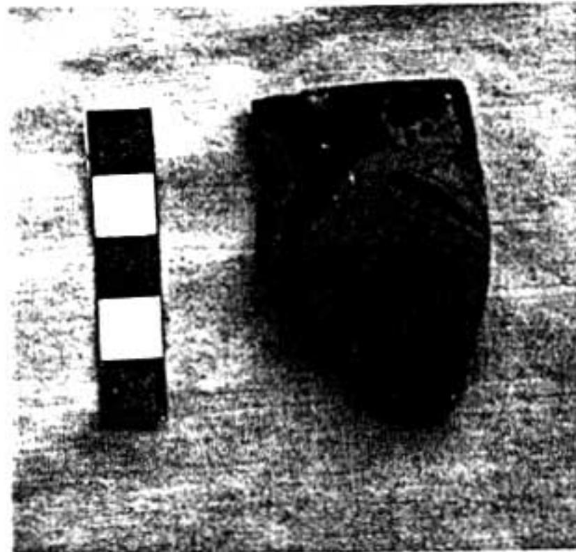
14. Fragment de skyphos attique à figures rouges (bord).

La seule description typologique ne saurait satisfaire l'historien ou l'archéologue soucieux de répondre à l'exigence formulée naguère par M. Wheeler, et opportunément rappelée ici même par A. Muller : derrière les artefacts, c'est bien l'homme qu'il faut atteindre 41 , les producteur, destinataire et utilisateur de l'objet, ainsi que l'usage qu'ils en font. Notons d'emblée que certains vases sont sans aucun doute des objets coûteux, voire luxueux. Bien sûr, les débats sur la valeur marchande de ces céramiques, décorées ou non 42 , et sur le concept de « céramique de luxe » ne sont pas clos 43 . Mais il est clair que ces vases grecs, notamment attiques, doivent être tenus à Chypre pour des objets de prestige. En la circonstance, la vaisselle d'importation paraît bien être dans l'île un « marqueur social ». La