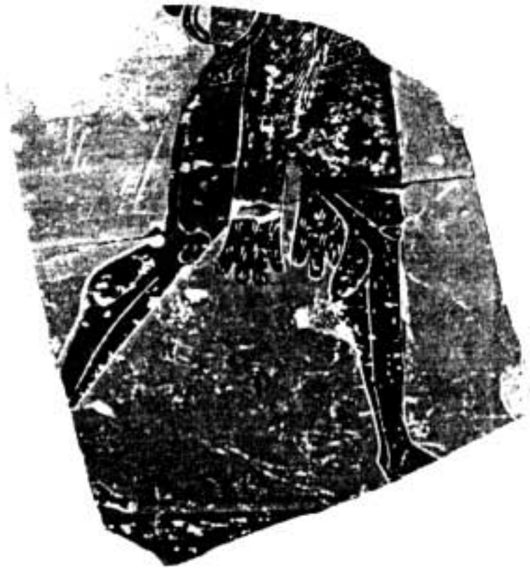
6. Fragment d'amphore attique à figures noires : Héraclès marchant.