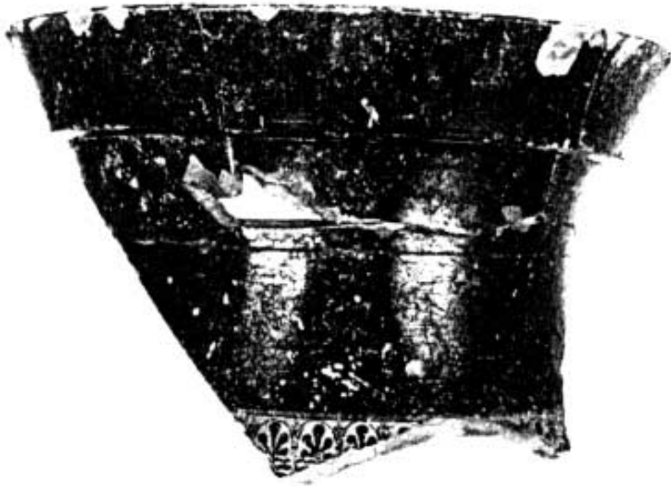
5. Fragment d'une amphore attique à figures noires (col).